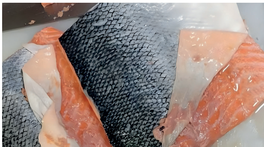
Figur 1. Bilde av skinn som løsner på laks.

Statistikk som bygger på reklamasjoner fra oppdrettsområder på Sørvestlandet viste at mer enn 90% av tilfellene skjedde i perioden fra juni til august, uten noen rapporterte tilfeller fra september til februar. I nord fant vi problemer med løst skinn noe lenger ut på året, fra sensommer til tidlig høst. Problemer med løst skinn er vanligvis midlertidige, og i et par tilfeller registrerte vi at skinnen festet seg etter to til tre måneder. De utfordrende periodene sammenfaller med tider med rask vekst og